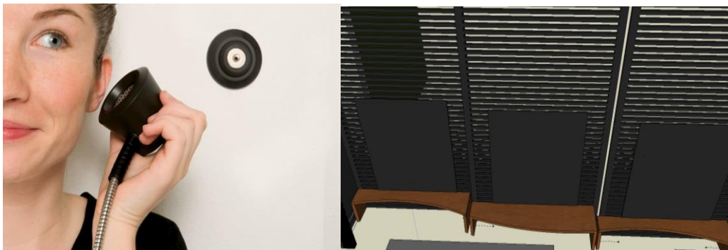
Ribbevegg med lyttestasjoner