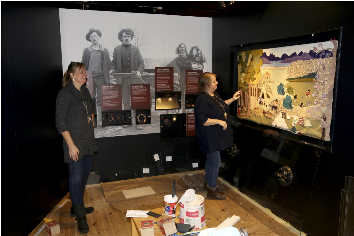
Vegg med sju personlige historier