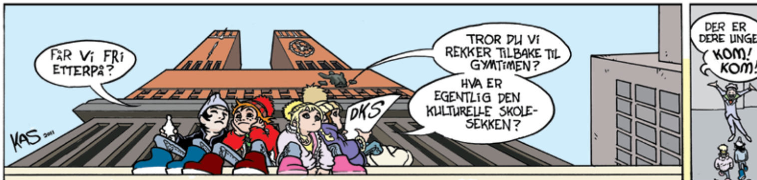
Tegnet og foralt av Knut Andre Solberg