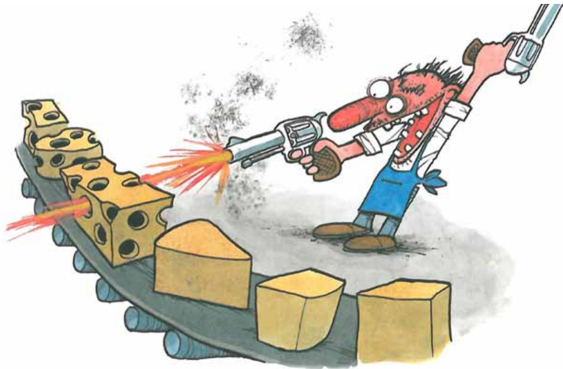
ILLUSTRATION JACOB MARTIN STRID