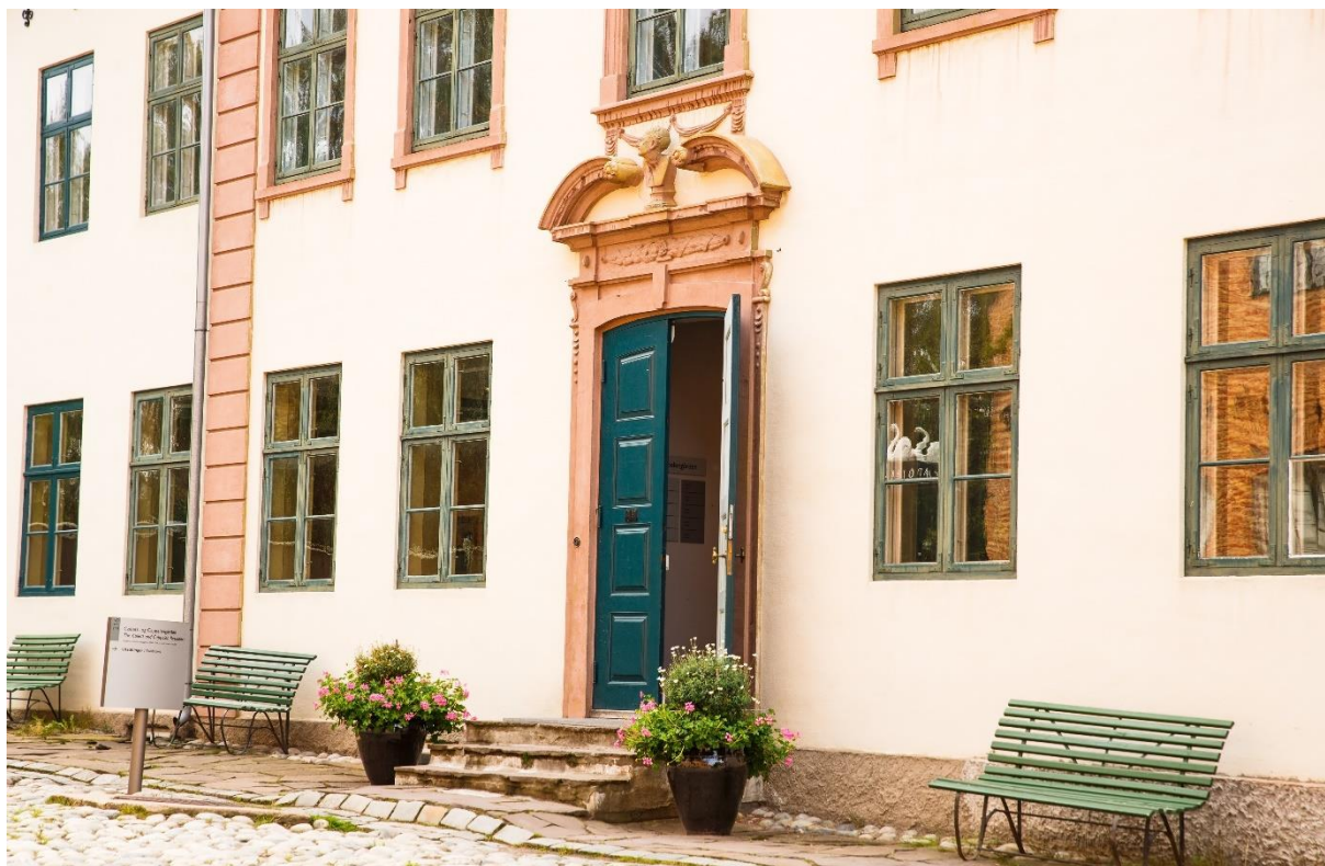
Fra Norsk Folkemuseum på Bygdøy

for hver kolonne fremgår i linjen for "No. of interviews" som viser netto antall gjennomførte intervju. Disse tallene er vektet opp for å også kunne representere de museer som ikke har svart, slik at tallene gjelder for hele bestanden med 53 museer. Vi går nærmere inn på dette nedenfor under avsnittet «Nærmere beskrivelse av analysen».