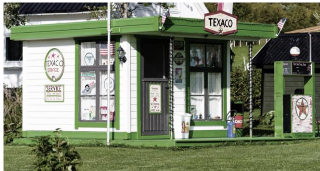
Bensinstasjon fra Lofoten, Norsk Folkemuseum på Bygdøy