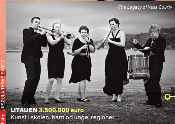
LITAUEN 3.500.000 euro Kunst i skolen, barn og unge, regioner.