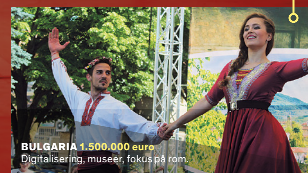
BULGARIA 1.500.000 euro Digitalisering, museer, fokus på rom.