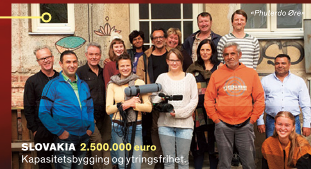
SLOVAKIA 2.500.000 euro Kapasitetsbygging og yringsfrihet.

EØS-MIDLENE FOR KUNST- OG KULTURSAMARBEID STØTTER