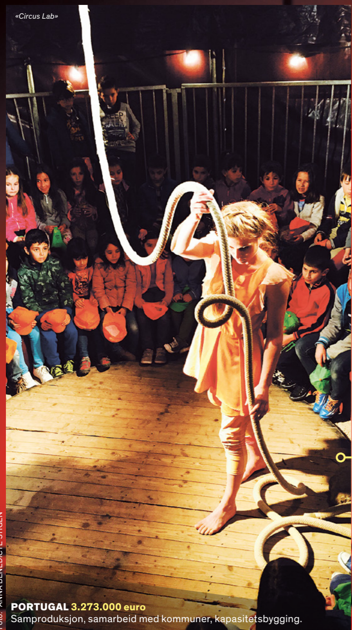
PORTUGAL 3.273.000 euro Samproduksjon, samarbeid med kommuner, kapasitetsbygging.