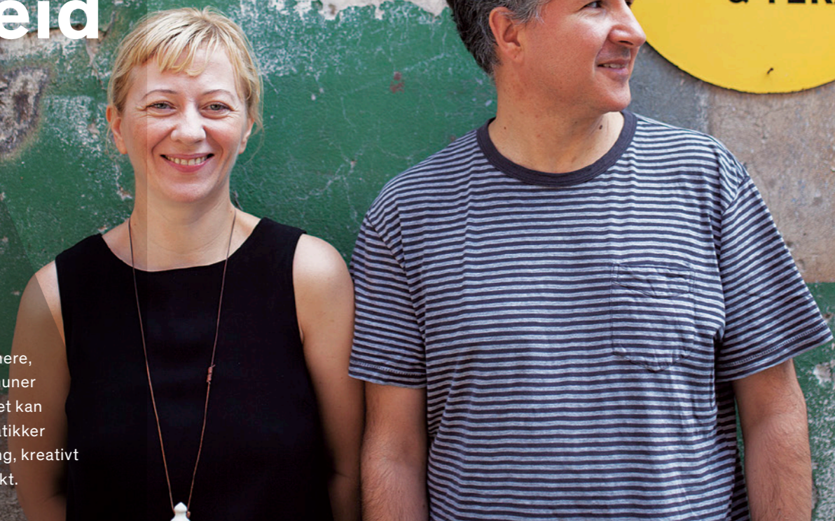
«Carol Factory Halls» Romania

Gjennom EØS-midlene har norske aktører innen kunst- og kulturfeltet en unik mulighet til å tilegne seg kunnskap og inspirasjon utenfor landegrensene. Fra 2019 utlyses det midler til kunst- og kulturprosjekter i åtte forskjellige land i Sentral- og Sør-Europa. Kunstnere, institusjoner, kommuner, fylkeskommuner og andre relevante aktører innen feltet kan delta som samarbeidspartnere. Tematikker som publikumsutvikling, lokal utvikling, kreativt næringsliv og samskaping vil stå sterkt.