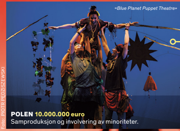
POLEN 10.000.000 euro Samproduksjon og involvering av minoriteter.