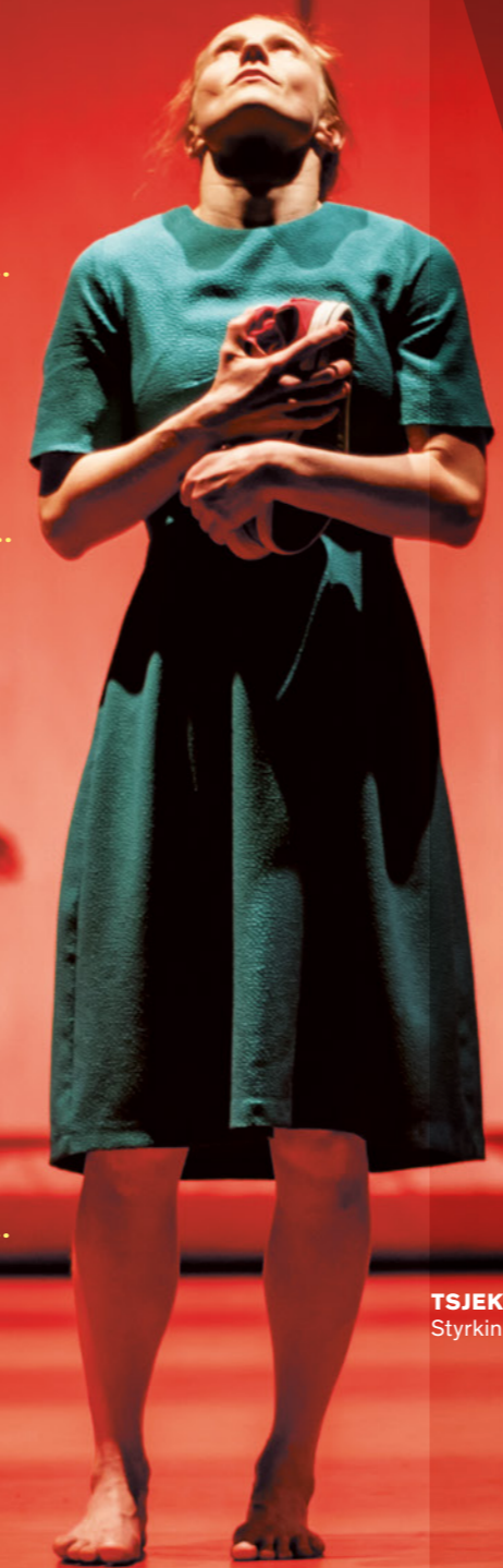
TSJEKKIA 7.000.000 euro Styrking av samtidskunst og kunstkritikk.