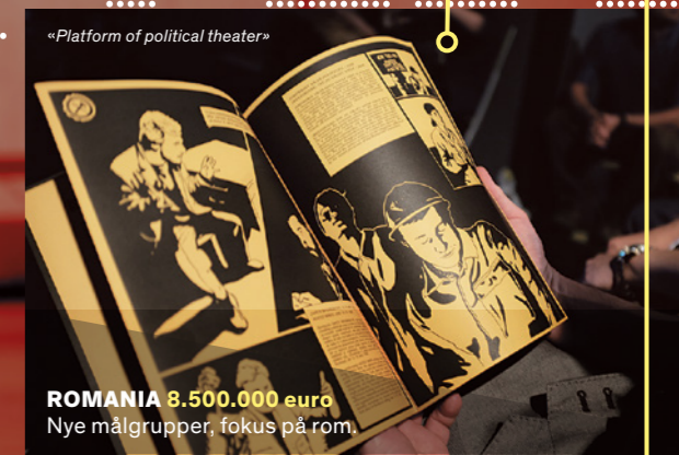
ROMANIA 8.500.000 euro Nye målgrupper, fokus på rom.