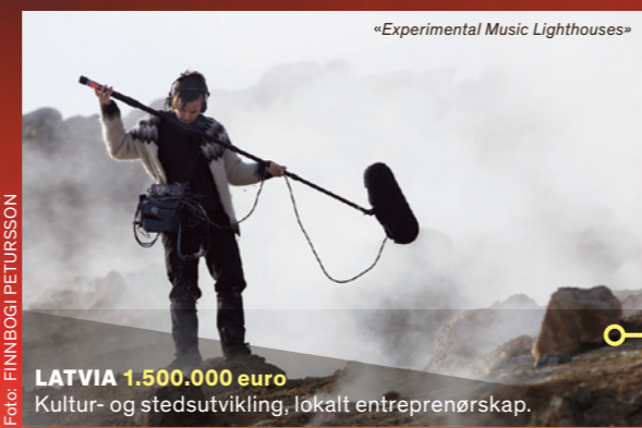
LATVIA 1.500.000 euro Kultur- og stedsutvikling, lokalt entreprenørskap.