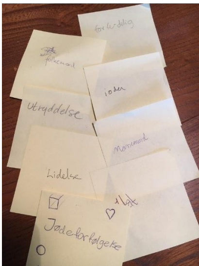
Elevers assosiative kommentarer til «Holocaust».