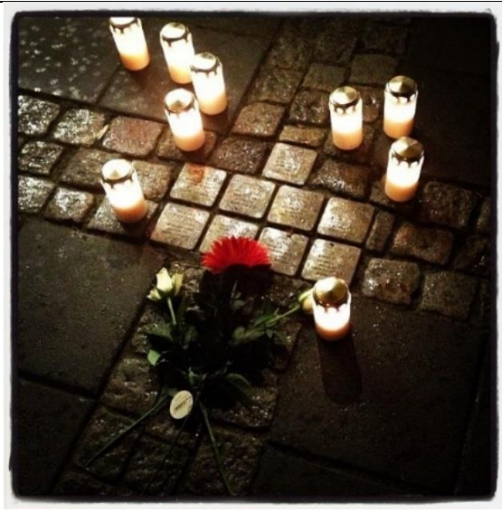
Minnestund ved snublesteinene i Larvik.