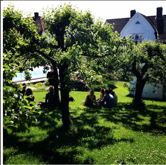
Elever samlet i familien Sachnowitz eplehage. Et tre ble plantet for hvert av barna da de ble født.